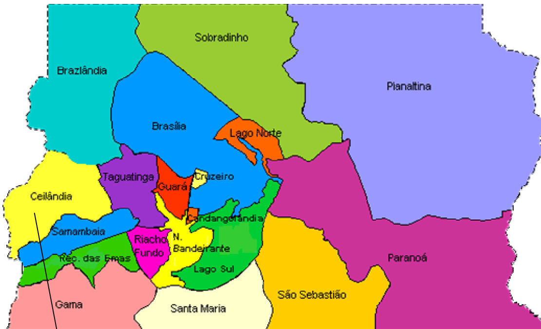
Figura 1: Mapa do Distrito Federal